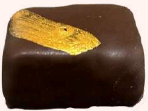
Almofadinha Duja de Amendoim