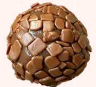
Belga ao Leite