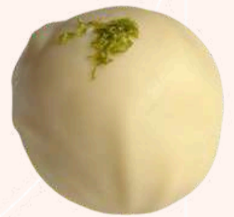
Trufa de Limão