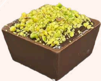
Caixinha de Pistache