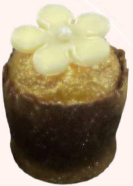
Vasinho de Flor