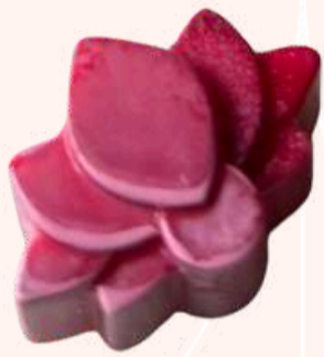
Flor de Lótus