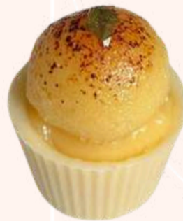
Brûlée e Morango