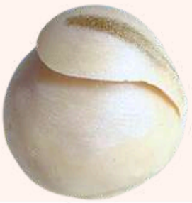
Véu de Noiva